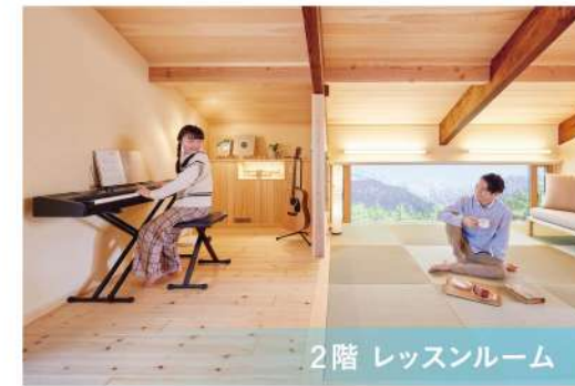
2階 レッスンルーム

独立した空間で、成長とともに身に付く自立力。でも孤立はしない。気配で伝わるふたりの想い。